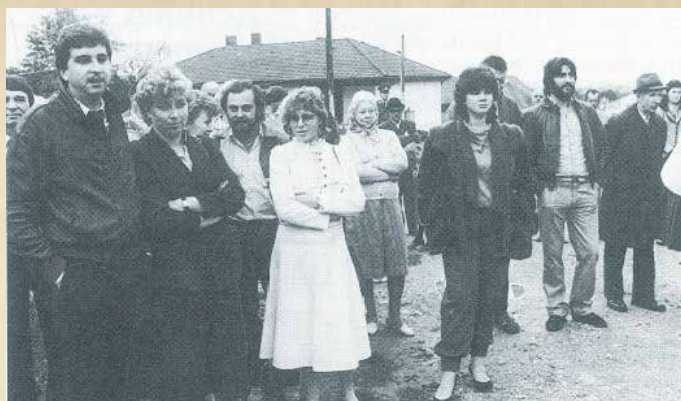
Die zukünftigen jungen Mieter waren ebenfalls anwesend.