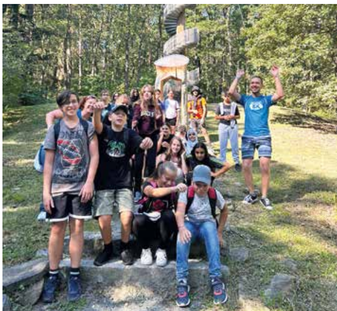
Die 3b besuchte den Aussichtsturm