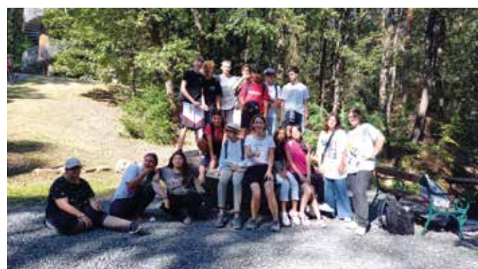
Die 4b genoss die frische Waldluft