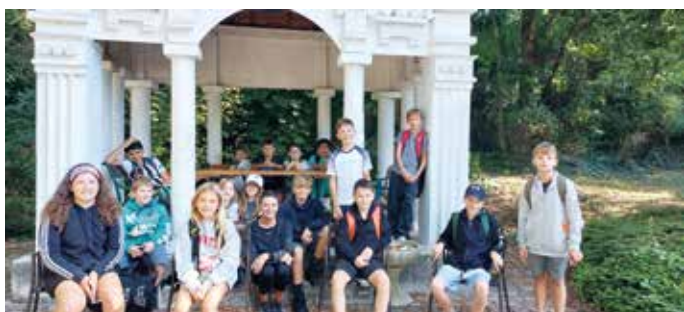
Die 1a führte es nach Bad Sauerbrunn, wo eine kurze Rast eingelet wurde

Neben den organisatorischen Tätigkeiten, die in der ersten Schulwoche in den einzelnen Klassen zu erledigen sind, ist es uns sehr wichtig, dass für unsere Kinder diese traditionelle Projektwoche zur Klassengemeinschaftsbildung beziehungsweise -stärkung bei uns an der Schule stattfindet. Hierbei können sich vor allem die SchülerInnen und LehrerInnen der neuen 1. Klassen intensiv kennenlernen, die Kids können sich an ihren neuen Lernort, die neuen Fächer und an das neue Gebäude gewöhnen, um startklar für das Schuljahr zu sein. Deshalb gab es neben der Erkundung und Kennenlernspielen im Schulgebäude auch einige Ausflüge.