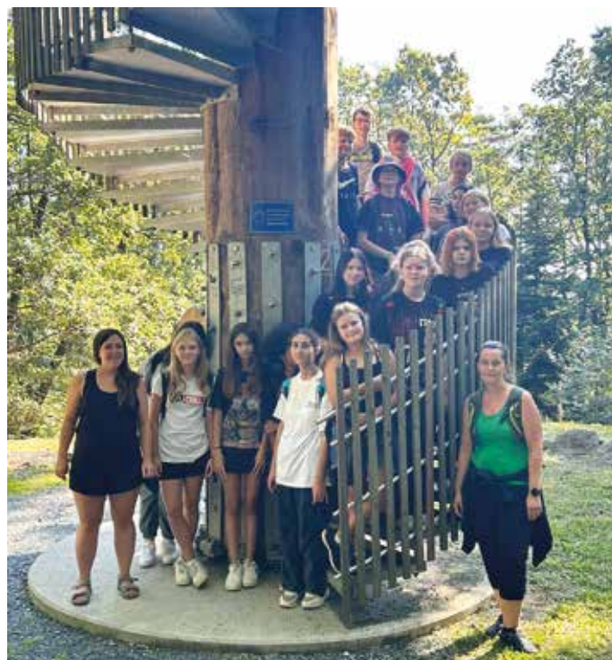
Die 3c wagte es in luftige Höhen