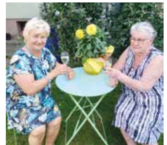
Herzlichen Glückwunsch an Eva Köckenbauer zum 80. Geburtstag