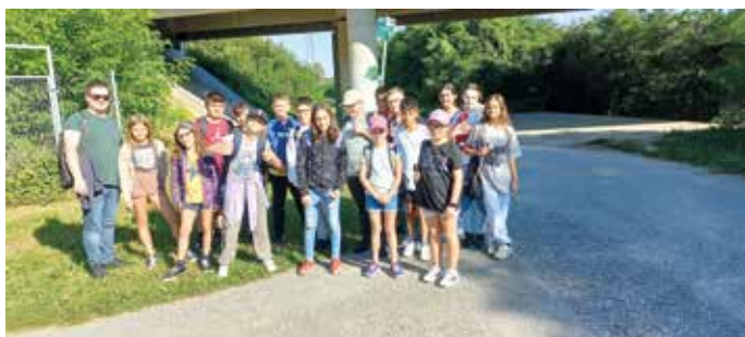
Auch die 1b wanderte auf dem Radweg in den Nachbarort