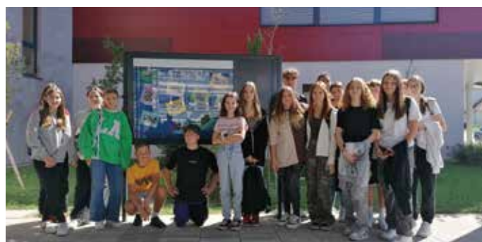
Die Kids der 4a gestalteten mit Freude und großem Eifer unseren Schaukasten.