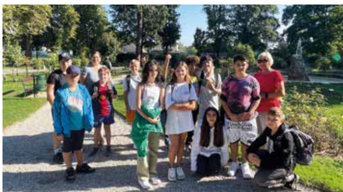
Die 2b machte einen Stopp im Rosarium

Ein herzliches Willkommen nach den Sommerferien all unseren SchülerInnen! Die Klassen starteten mit zahlreichen Outdooraktivitäten in das neue Schuljahr! Das herrliche Wetter trug dazu bei, dass man die Schwimmbäder in Bad Sauerbrunn und Mattersburg besuchen konnte. Es wurde aber auch kreative Arbeit geleistet und viel gewandert. Dabei besuchten die Kinder verschiedene Stationen in unserem Nachbarort Bad Sauerbrunn. Ausreichend Spiel und Spaß kamen in dieser Woche nicht zu kurz!