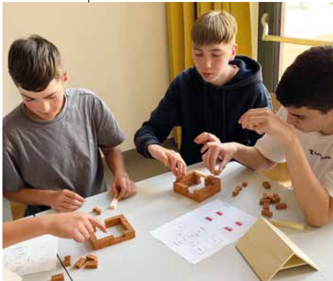
Die Burschen zeigten großes Talent beim Fertigen der Bauwerke

eines Bauprojekts. Im Anschluss an den informativen Vortrag hatten die SchülerInnen die Gelegenheit, ihre eigenen Fähigkeiten als „Baufrauen/Bauherren“ unter Beweis zu stellen. Ausgestattet mit einer Fülle an kleinen Ziegeln und anderen Bauelementen formten sie nicht nur Häuser, sondern auch Skulpturen nach Plan.