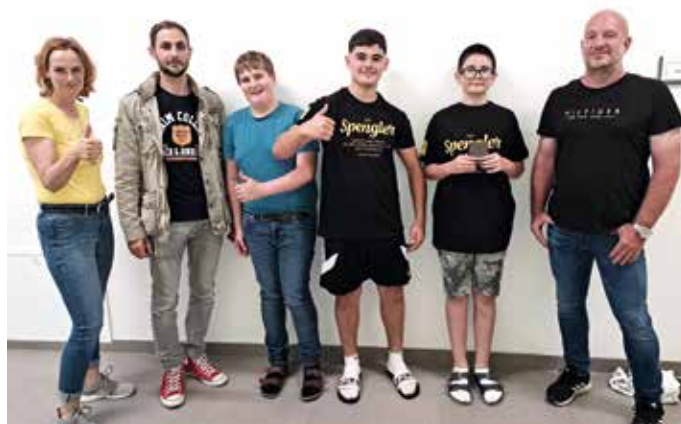
Die Verlosung von T-Shirts war der krönende Abschluss dieser informativen Veranstaltung

Als Highlight wurde ein Gewinnspiel durchgeführt, bei dem die SchülerInnen die Chance hatten, T-Shirts und Arbeitshandschuhe zu gewinnen. Die Verlosung erfolgte am Ende des Events und sorgte für große Freude bei den GewinnerInnen.