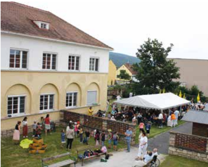
Groß und Klein unterhielten sich prächtig

Das Pflegewohnhaus Neudorf veranstaltete am 27.06. ein BewohnerInnenfest. Eingeladen waren Kinder der Volksschule Neudorf. Diese brachten mehrere Lieder für die BewohnerInnen dar. Anschließend gab es für sie einen Parcours mit verschiedenen Stationen – Hufeisenwerfen, Basketball, Dosenschießen, Hindernislauf und Geschicklichkeitsspiel mit Bällen. Auf jeder Station durften sich die Kinder etwas Süßes nehmen und wenn man alle Stationen durch hatte, bekam man ein kleines Geschenk. Zum Abschluss gab es ein leckeres Eis für alle Kinder.