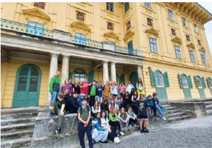
Die SchülerInnen waren vom Schloss Esterhazy beeindruckt

Trotz Regens machten sich die 2b und die 2c am 07.06. auf den Weg nach Eisenstadt, um das Wirken Joseph Haydns in der Landeshauptstadt zu entdecken. Zuerst wurden die Prunkräume des Schlosses Esterhazy, der Haydnssaal und zahlreiche antike Möbel und Kunstgegenstände bewundert. Danach gingen die beiden Klassen zur Bergkirche, um das Mausoleum des Musikers und den Kalvarienberg zu besuchen. Mit vielen schönen Eindrücken und Erinnerungen ging es zurück zur Schule. Ein tolles Erlebnis!