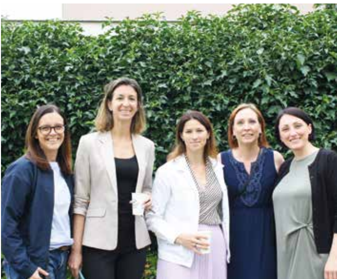
Das Leitungsteam freute sich über die vielen Gäste

Im Anschluss wurde für die BewohnerInnen und MitarbeiterInnen gegrillt und das Fest musikalisch untermalt. Sowohl die BewohnerInnen als auch die kleinen Gäste genossen diese gelungene Veranstaltung.