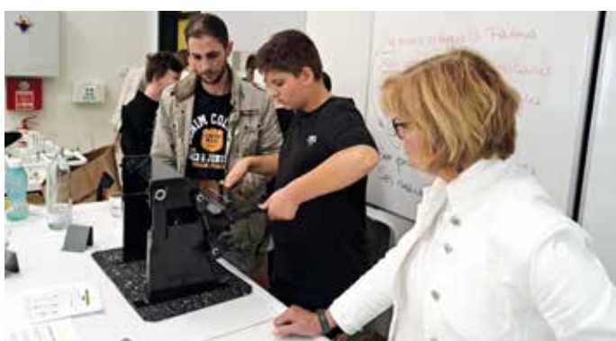
Nach einer kurzen Einschulung ging man motiviert ans Werk

Nach dem interaktiven Vortrag fertigten die Kids mit Unterstützung des Firmenchefs der Firma Feigl und Schwarz eine Handyhalterung aus Metall. Durch diese praktische Übung bekamen die Jugendlichen ein weiteres Mal die Chance, ihre handwerklichen Fähigkeiten auszuprobieren und erste Erfahrungen im Umgang mit Metall zu sammeln.