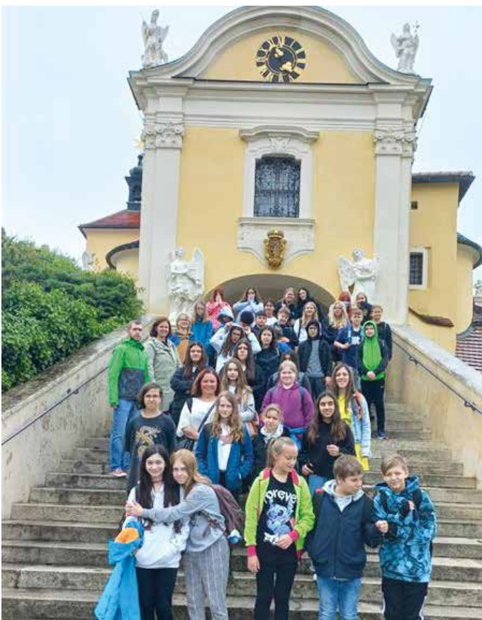
Das Mausoleum in der Bergkirche war besonders interessant