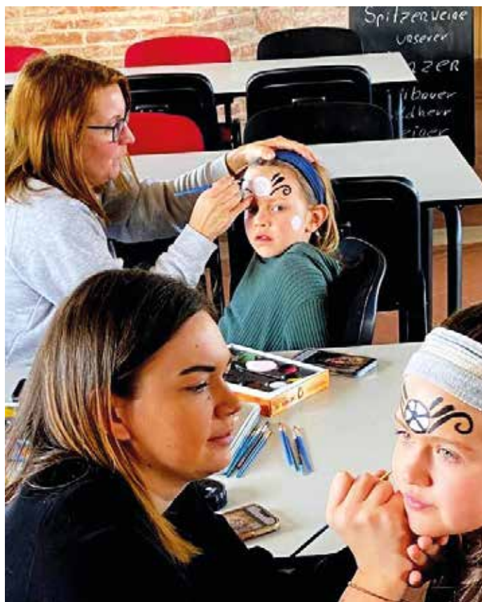
Beim Spiel gegen Pilgersdorf organisierten die Neudorfler Kinderfreunde ein fußballbezogenes Kinderschminken, das bei unseren jungen Fans überaus beliebt war.

Festsitzung Sonntag 5. November 10 Uhr Martinihof