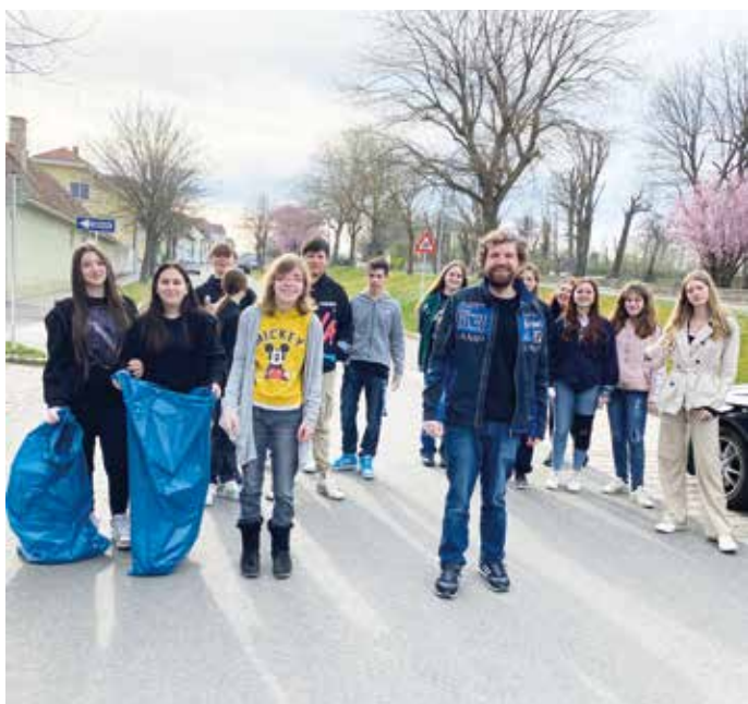
Die 4b sammelt fleißig

In der Woche vor Ostern sammelten unsere SchülerInnen im Zuge der Flurreinigung unzählige weggeworfene Gegenstände und Abfälle ein. Einige Müllsäcke waren bis zum Rand gefüllt. Diese Aktion passt auch sehr gut zu unserem ökologischen Schuljahresthema, der richtigen Mülltrennung. Dadurch wollen wir bei unseren Kindern das Bewusstsein für Umweltschutz stärken.