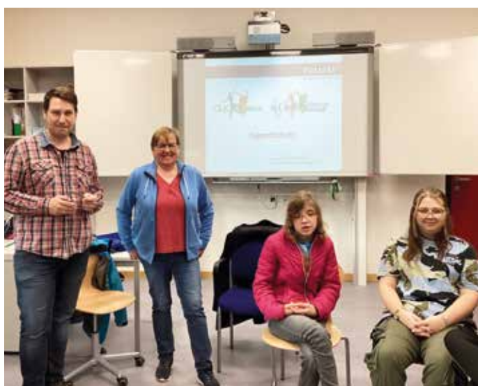
Die 4b beim interessanten Click und Check-Workshop

In einigen Klassen fanden, wie bereits in den Jahren zuvor, Workshops zu den Themen „Safer Internet“ und „Jugendschutz“ statt. Am 30.03.2023 gab es dazu in der 4b einen kriminalpräventiven Vortrag rund um das Thema „Jugendschutz“. Die Kinder brachten ihre bisher gesammelten Erfahrungen ein und erhielten viele wertvolle Tipps und Informationen.