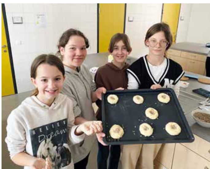
Ab in den Ofen!

Die 3a ist nicht nur Podcast-Profi, sondern überrascht auch mit Backkünsten. Im Biologie-Unterricht wurden vor Ostern im Zuge des Themas „Vom Korn zum Brot“ leckere Brötchen selbst hergestellt und nach dem Abkühlen auch gleich verzehrt. Den Kindern hat diese kreative Unterrichtsform, wie man auf den Bildern erkennen kann, sehr gut gefallen.