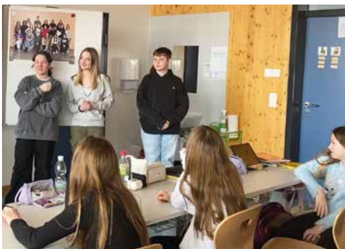
Eine der vielen tollen Podcastgruppen in der 3a

Im Rahmen des Englisch-Unterrichtes beschäftigten sich die SchülerInnen der 3a mit dem Erstellen von Podcasts. Die Vorgangsweise dabei war sehr professionell. Die Kinder erstellten in Gruppen Interviews zu den Themen „Family, Social Media und friends“, nahmen diese auf und spielten sie danach der Klasse vor. Die künftigen PodcasterInnen hatten viel Spaß und große Freude bei der Arbeit.