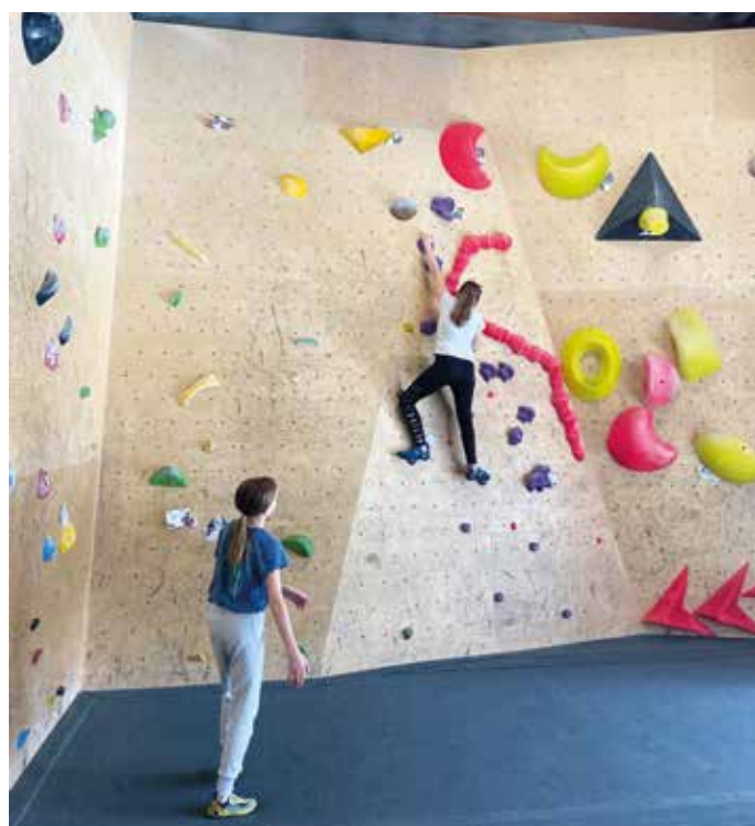
Mit vollem Einsatz bei der Sache

Am 9.3. besuchten unsere sportbegeisterten Mädchen der Schwerpunktklassen Sport die Boulderhalle in Wiener Neustadt. Dabei konnten die Mädels ihre Kletterkünste unter Beweis stellen, etwaige Höhenängste überwinden und tolle Erfahrungen sammeln. Da es Kletterrouten in verschiedenen Schwierigkeitsgraden gibt, war für alle etwas Passendes dabei.