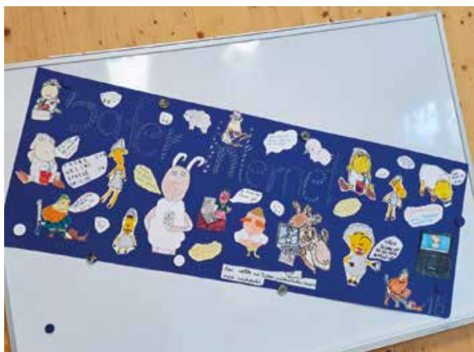
Im Internet sicher unterwegs sein