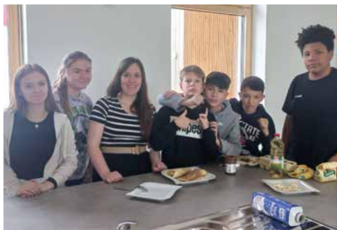
Französisch-Unterricht mal anders

Ein kleiner Exkurs aus der französischen Küche: Passend zur Faschingswoche wurden in den 3. Klassen eifrig Crêpes gebacken und natürlich auch verspeist. In den französischen Familien stehen diese nämlich besonders oft am „Mardi gras“, am Faschingdienstag, am Speiseplan.