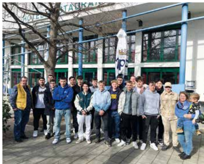
"Tauglich!" hieß es für alle Neudörfler Burschen

Am 15. März lud die Gemeinde jene jungen Männer zu einem Mittagessen in den Martinihof ein, die in diesem Jahr zur Musterung aufgerufen wurden. Die Stellung selbst dauerte eineinhalb Tage. Dabei wurden sowohl medizinische (u.a. Seh-, Hör- und Bluttests), sportliche Belastungstests als auch psychologische Tests gemacht, anhand derer festgestellt wurde, ob jemand für den Wehrdienst geeignet ist. Die jungen Männer des heurigen Musterungsjahres wurden alle als tauglich eingestuft – ein Phänomen, das man in Neudörfel schon lange nicht mehr wahrgenommen hat.