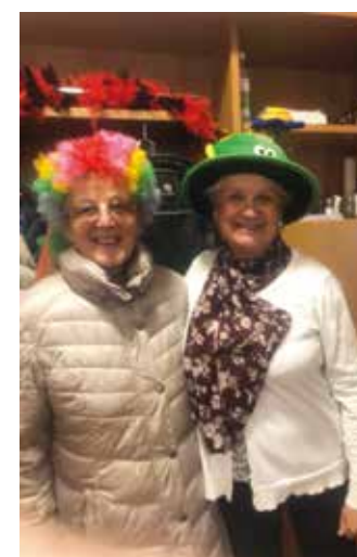
Fröhliches Beisammensein beim Faschingsfest

Elektro-Installationen, Kundendienst und Verkauf