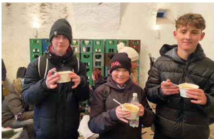
Mit heißer Suppe stärkte man sich für die restlichen Kilometer