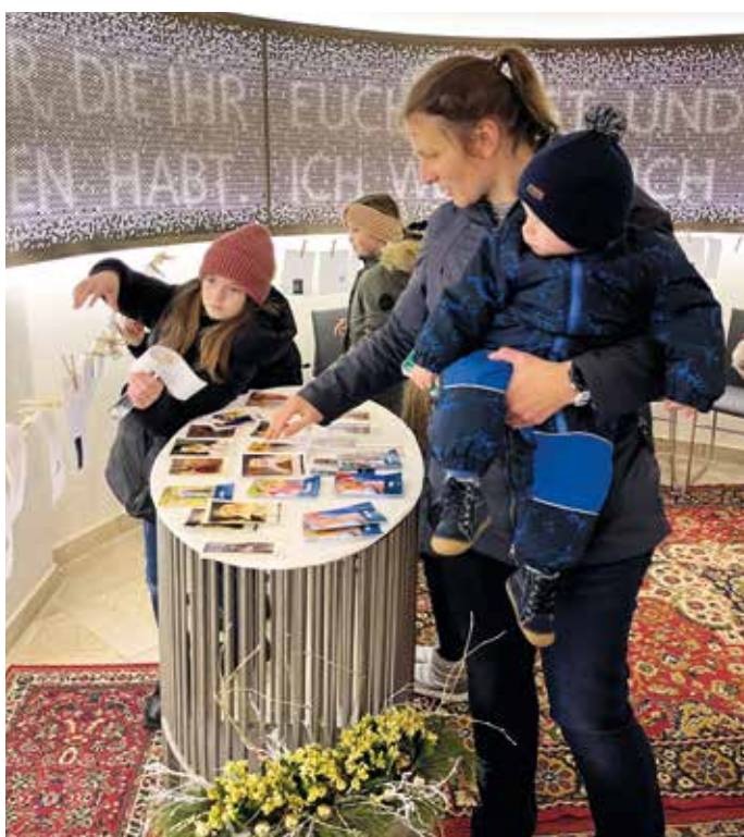
Für jedes Kind lag eine Kärtchen mit seinem Namenspatron bereit