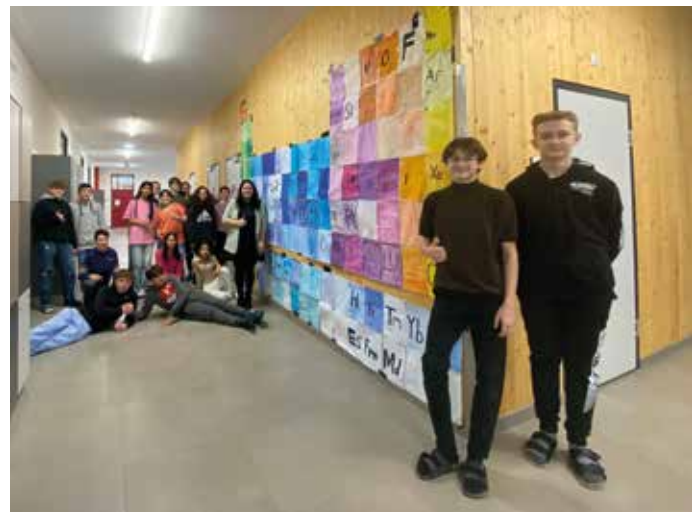
Die stolze 3B vor ihrem Meisterwerk