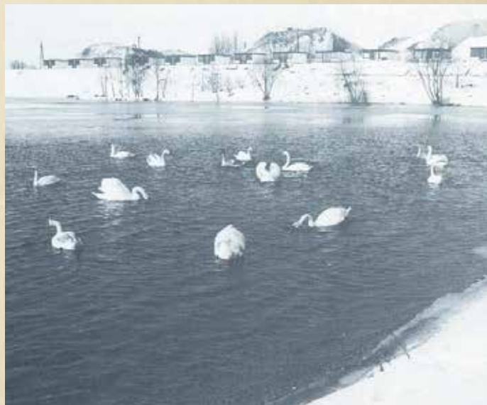
Trotz kalter Temperaturen gab es tierischen Besuch am Badesee in Neudörfel