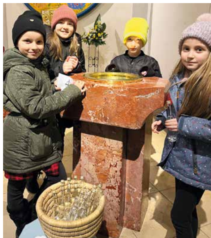
Als besonderes Geschenk gab es Weihwasser, welches an die Taufe erinnern soll