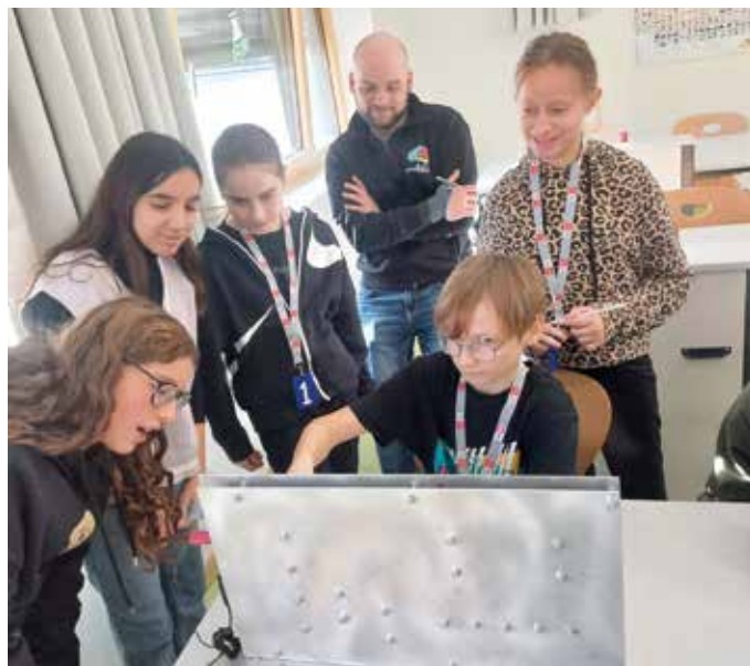
Es wurde eifrig beobachtet, wie jeder die einzelnen Übungen meisterte

Im Jänner durften alle zweiten Klassen am Projekt „MOBITA“ des BFI teilnehmen. Der Mobita-Talentecheck bietet den SchülerInnen die Chance, Fähigkeiten, die für technisch-handwerkliche Berufe notwendig sind, zu entdecken. An verschiedenen Stationen testeten die Kinder ihre Begabungen und lernten dabei Berufe mit Zukunft kennen. Nach erfolgreicher Absolvierung bekamen die SchülerInnen ihre persönliche Auswertung.