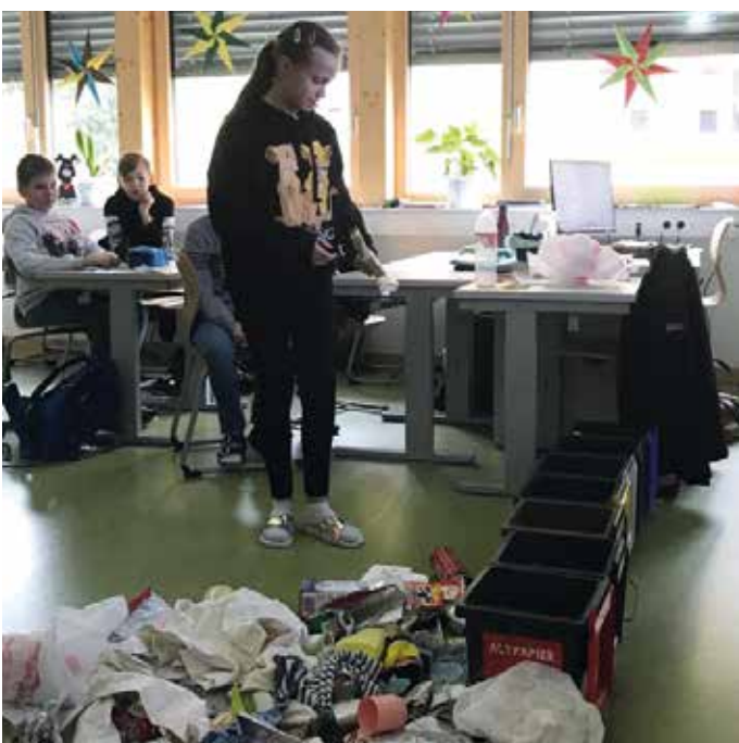
Bestens eingeschult ging es ans Mülltrennen