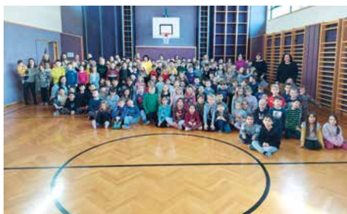
Vier Tage lang wurde das Schifahren und Snowboarden perfektiert