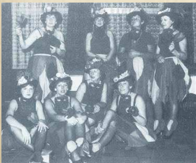
Die Fußballer- und Funktionärsfrauen, verkleidet als "Maria aus Bahia"

Emsiges Treiben herrscht zur Zeit am Badesee in Neudörfel. Dort, wo sich den Sommer über hunderte Badelustige tummeln, hat sich eine größere Anzahl von Schwänen niedergelassen. Da das Wasser nicht völlig zu Eis erstarrt ist, finden die langhalsigen Vögel sogar noch Futter vor. Und ab zu zu bringen auch Besucher ein paar Brocken Nahrung mit, die dankbar angenommen werden.