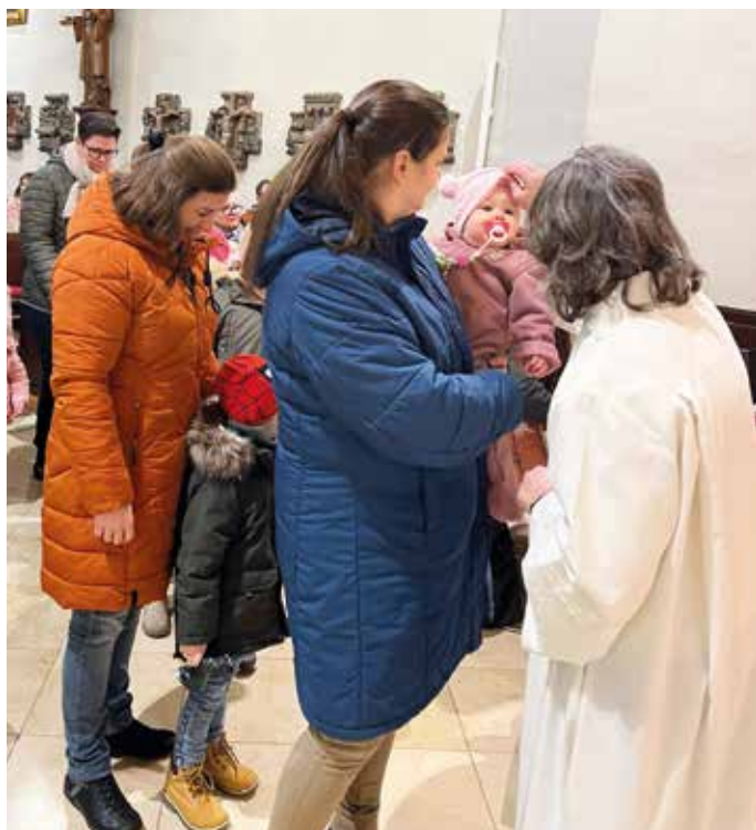
Natürlich wurden die kleinen Besucher auch gesegnet